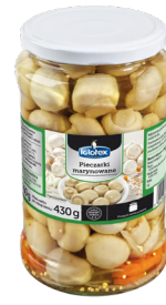
Pieczarki marynowane z marchewką 815 ml

gramatura 4,5 kg EAN 5 902 162 332 546 szt. w opak. zb. 1 szt. na warstwie 33