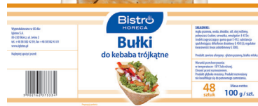
Bułka trójkątna do kebaba 19x19 cm

gramatura 100 g EAN 5 902 162 010 697 szt. w opak. zb. 24 szt. na warstwie 144