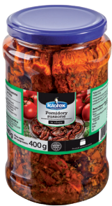
Pomidory suszone w oleju z ziołami 815 ml

gramatura 760 g / 430 g EAN 5 900 664 014 007 szt. w opak. zb. 6 szt. na warstwie 96