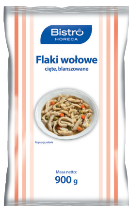
Flaki wołowe cięte blanszowane

gramatura 770 g EAN 5 907 701 807 639 szt. w opak. zb. 8 szt. na warstwie 64