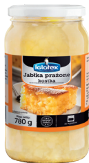
Jabłka prażone 90% kostka

gramatura 3,2 kg EAN 5 902 162 008 083 szt. w opak. zb. 1 szt. na warstwie 24