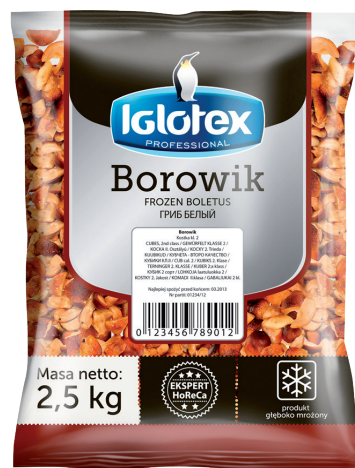
Borowik kostka kl. 2

gramatura 2,5 kg EAN 5 902 162 007 208 szt. w opak. zb. 4 szt. na warstwie 36