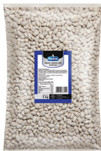
Fasola piękny Jaś karłowaty

gramatura 3 kg EAN 5 902 162 366 916 szt. w opak. zb. 3 szt. na warstwie 24