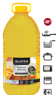
Frytura płynna bez oleju palmowego