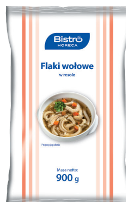
Flaki wołowe w rosole

gramatura 900 g EAN 5 902 162 395 312 szt. w opak. zb. 10 szt. na warstwie 70