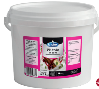
Wiśnie w żelu

gramatura 3,2 kg EAN 5 902 162 008 090 szt. w opak. zb. 1 szt. na warstwie 24