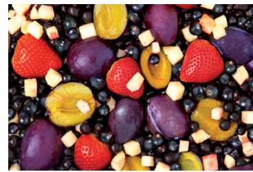
Mieszanka kompotowa 4-składnikowa b/p

Skład: zależny od danego sezonu, sprawdź u Przedstawiciela Handlowego