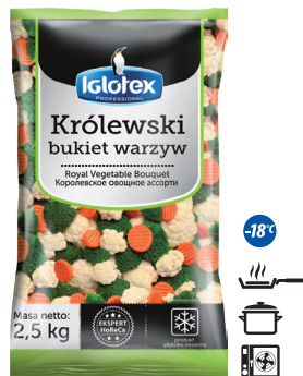
Królewski bukiet warzyw

gramatura 2,5 kg EAN 5 902 162 364 219 szt. w opak. zb. 4 szt. na warstwie 36 Skład: brokuł różyczki, kalafior różyczki, marchew plastry