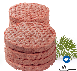
Burger wołowy 200 g