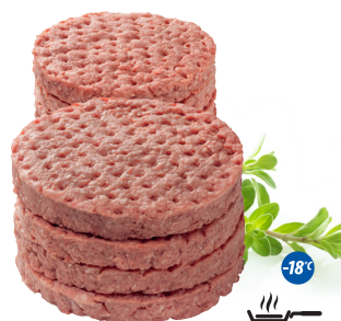
Burger wołowy 180 g