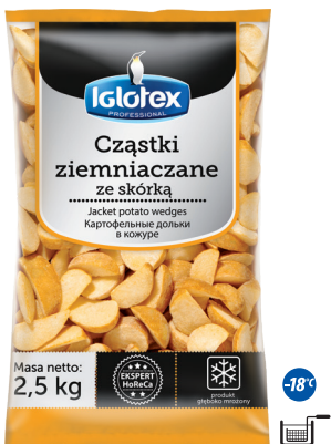
Częstki ziemniaczane ze skórka

gramatura 2,5 kg EAN 5 902 162 362 611 szt. w opak. zb. 5 szt. na warstwie 45