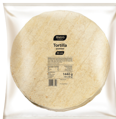
Tortilla 30 cm

gramatura 18 x 62 g EAN 5 902 162 328 211 szt. w opak. zb. 8 szt. na warstwie 48