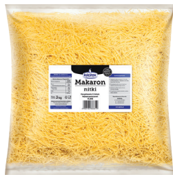
Makaron nitka cięta

gramatura 3 kg EAN 5 902 162 366 619 szt. w opak. zb. 3 szt. na warstwie 24