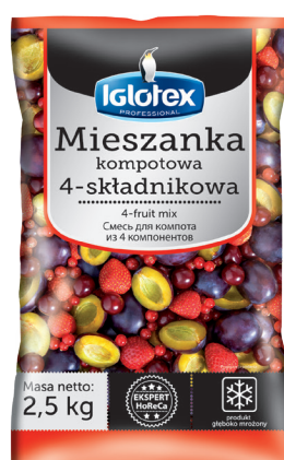
Mieszanka kompotowa 4-składnikowa