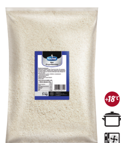
Ryż biały długoziarnisty

gramatura 5 kg EAN 5 902 162 009 622 szt. w opak. zb. 1 szt. na warstwie 10