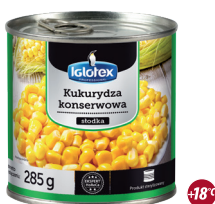
Kukurydza konserwowa słodka, próżniowa

gramatura 2490 g / 1745 g EAN 5 902 162 336 841 szt. w opak. zb. 1 szt. na warstwie 35