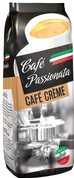
Café Passionata Café Crème

gramatura 1 kg EAN 5 902 162 380 110 szt. w opak. zb. 6 szt. na warstwie 72