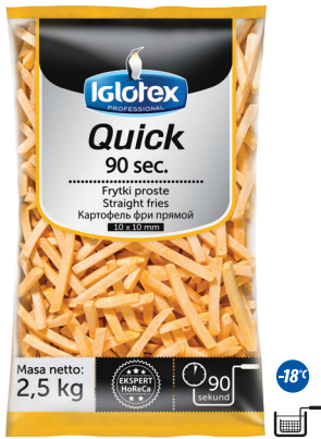
Frytki Quick 90 sec. proste 10x10

gramatura 2,5 kg EAN 5 902 162 362 116 szt. w opak. zb. 5 szt. na warstwie 45