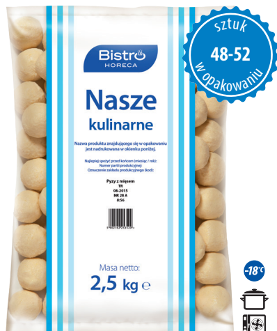
Pyzy z mięsem

gramatura 2,5 kg EAN 5 902 162 260 825 szt. w opak. zb. 4 szt. na warstwie 36