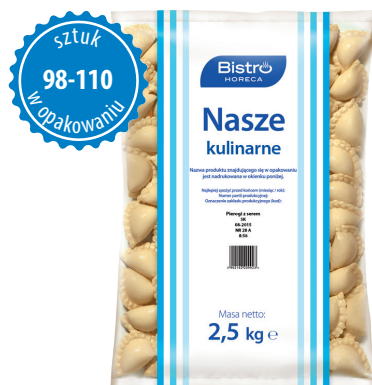
Pierogi z serem

gramatura 2,5 kg EAN 5 902 162 212 923 szt. w opak. zb. 4 szt. na warstwie 36