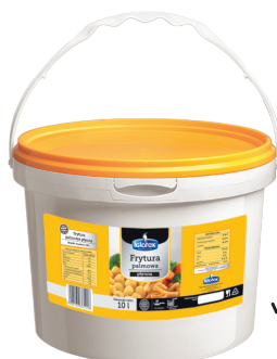
Frytura palmowa płynna