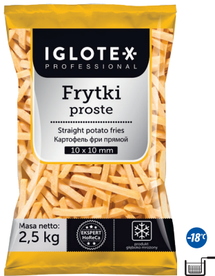
Frytki proste 10x10

gramatura 2,5 kg EAN 5 902 162 362 413 szt. w opak. zb. 4 szt. na warstwie 36