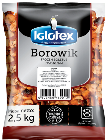
Borowik kostka kl. 1

gramatura 2,5 kg EAN 5 902 162 007 185 szt. w opak. zb. 4 szt. na warstwie 36