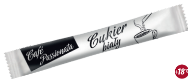
Cukier biały paluszek

gramatura 4 g EAN 5 902 162 000 353 szt. w opak. zb. 1 (700) szt. na warstwie 12 (8400)