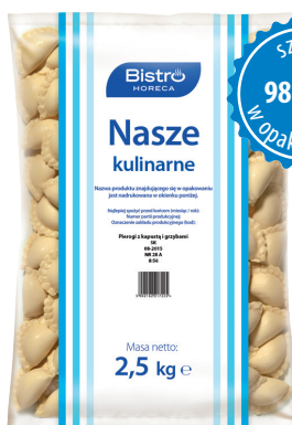
Pierogi z kapustą i grzybami

gramatura 2,5 kg EAN 5 902 162 213 029 szt. w opak. zb. 4 szt. na warstwie 36