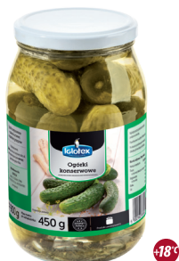
Ogórki konserwowe 900 ml

gramatura 2,12 kg / 1775 g EAN 5 902 162 009 929 szt. w opak. zb. 1 szt. na warstwie 35