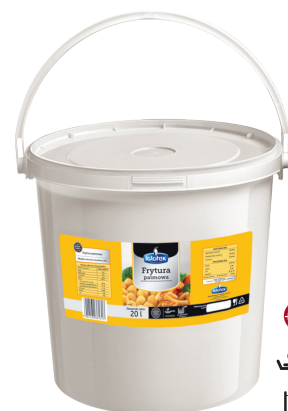
Frytura palmowa półpłynna