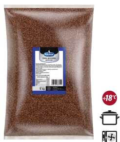
Kasza gryczana prażona

gramatura 5 kg EAN 5 902 162 009 561 szt. w opak. zb. 1 szt. na warstwie 10