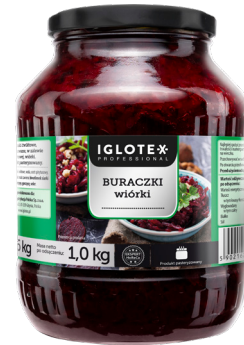
Buraczki wiórki 1,6 kg

gramatura 1,4 kg / 800 g EAN 5 902 162 004 696 szt. w opak. zb. 6 szt. na warstwie 96