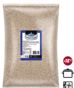
Kasza jęczmienna wiejska gruba

gramatura 5 kg EAN 5 902 162 009 578 szt. w opak. zb. 1 szt. na warstwie 10