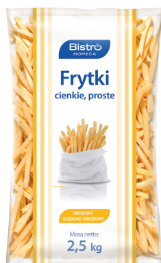
Frytki cienkie, proste 8x8

gramatura 2,5 kg EAN 5 902 162 367 418 szt. w opak. zb. 5 szt. na warstwie 45