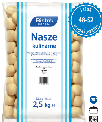
Knedle z truskawkami

gramatura 2,5 kg EAN 5 902 162 008 229 szt. w opak. zb. 4 szt. na warstwie 36