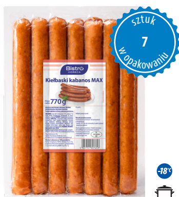
Kiełbaski kabanos MAX

gramatura 700 g EAN 5 902 162 386 716 szt. w opak. zb. 8 szt. na warstwie 64