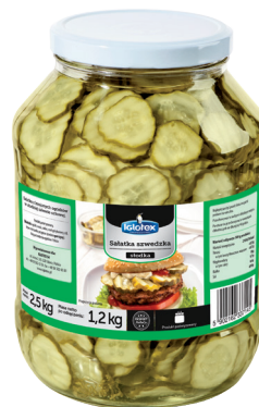
Sałatka szwedzka 2,65 l

gramatura 1600 g / 840 g EAN 5 902 162 336 049 szt. w opak. zb. 3 szt. na warstwie 54