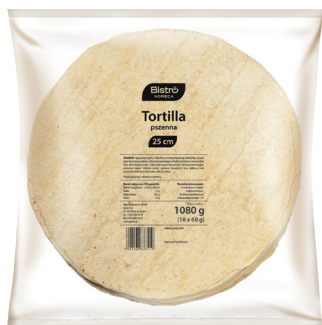
Tortilla 25 cm

gramatura 100 g EAN 5 902 162 010 697 szt. w opak. zb. 24 szt. na warstwie 144