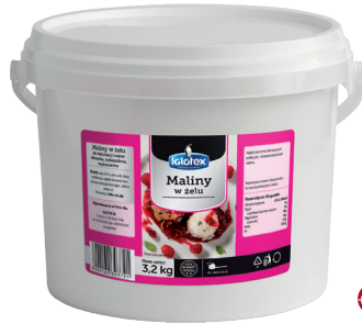
Maliny w żelu

gramatura 3,2 kg EAN 5 902 162 393 721 szt. w opak. zb. 1 szt. na warstwie 24