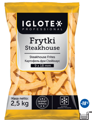
Frytki Steakhouse 9x18

gramatura 2,5 kg EAN 5 902 162 362 512 szt. w opak. zb. 5 szt. na warstwie 45