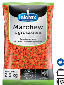
Marchew z groszkiem

gramatura 2,5 kg EAN 5 902 162 364 219 szt. w opak. zb. 4 szt. na warstwie 36 Skład: brokuł różyczki, kalafior różyczki, marchew plastry