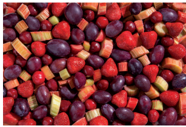
Kompot sezonowy b/p

gramatura 2,5 kg EAN 5 902 162 010 147 szt. w opakowaniu 4 szt. na warstwie 36