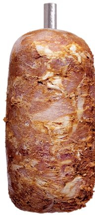
Kebab z udek i fileta kurczaka