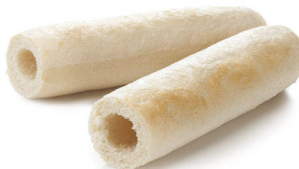
Bułka HOT-DOG francuski 60 g

gramatura 3 kg EAN 5 902 162 387 812 szt. w opak. zb. 1 szt. na warstwie 16