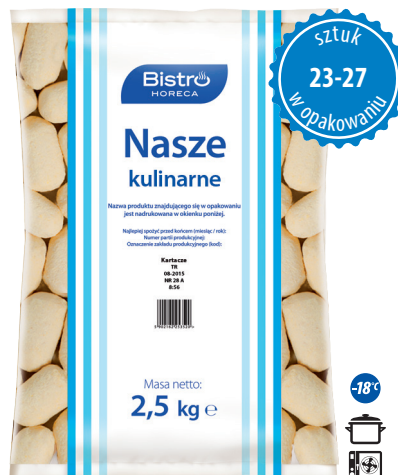
Kartacze z mięsem

gramatura 2,5 kg EAN 5 902 162 008 205 szt. w opak. zb. 4 szt. na warstwie 36