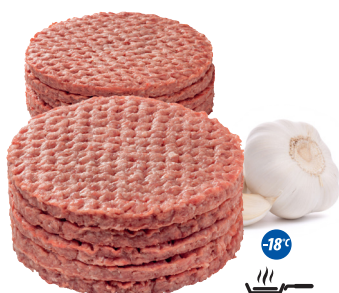
Burger wołowy 113 g