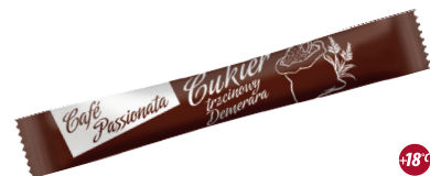
Cukier trzcinowy Demerara paluszek

gramatura 4 g EAN 5 902 162 000 346 szt. w opak. zb. 1 (700) szt. na warstwie 12 (8400)