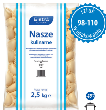
Pierogi z truskawkami

gramatura 2,5 kg EAN 5 902 162 209 923 szt. w opak. zb. 4 szt. na warstwie 36