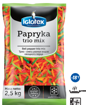
Papryka trio mix

gramatura 2,5 kg EAN 5 902 162 364 318 szt. w opak. zb. 4 szt. na warstwie 36 Skład: marchew kostka, groszek zielony