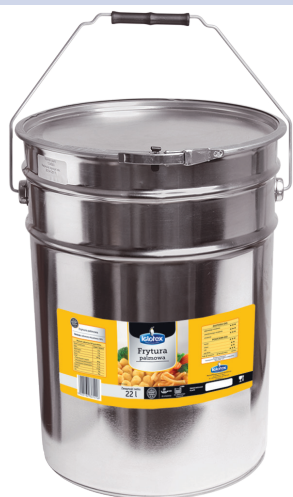
Frytura palmowa półpłynna