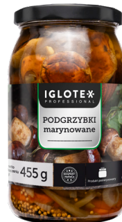
Podgrzybki marynowane całe 800 g

gramatura 800 g / 455 g EAN 5 902 162 004 757 szt. w opak. zb. 4 szt. na warstwie 168