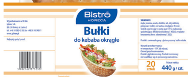
Bułka okrągła do kebaba ø30 cm

gramatura 450 g EAN 5 902 162 010 680 szt. w opak. zb. 5 szt. na warstwie 30