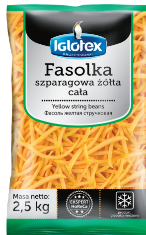
Fasolka szparagowa żółta, cała

gramatura 2,5 kg EAN 5 902 162 363 212 szt. w opak. zb. 4 szt. na warstwie 36 Skład: fasola zielona