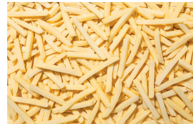
Frytki cienkie proste 7x7

gramatura 2,5 kg EAN 5 902 162 394 117 szt. w opakowaniu 4 szt. na warstwie 36