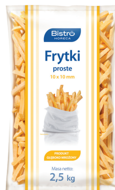
Frytki proste 10x10

gramatura 2,5 kg EAN 5 902 162 367 418 szt. w opak. zb. 5 szt. na warstwie 45