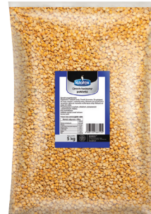
Groch łuskany półowki

gramatura 5 kg EAN 5 902 162 009 547 szt. w opak. zb. 1 szt. na warstwie 10