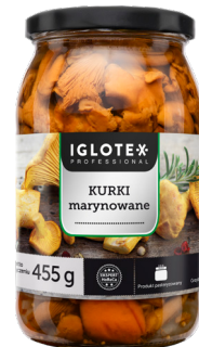
Kurki marynowane 800 g

gramatura 800 g / 455 g EAN 5 902 162 009 998 szt. w opak. zb. 4 szt. na warstwie 168