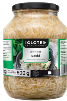
Seler paski 1,4 kg

gramatura 1440 g / 900 g EAN 5 900 664 014 298 szt. w opak. zb. 4 szt. na warstwie 48