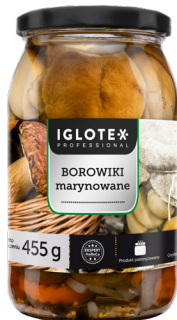
Borowiki marynowane całe 800 g

gramatura 670 g / 420 g EAN 5 902 162 010 307 szt. w opak. zb. 8 szt. na warstwie 96