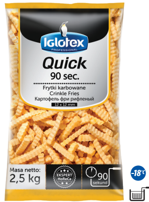
Frytki Quick 90 sec. karbowane 12x12

gramatura 2,5 kg EAN 5 902 162 362 116 szt. w opak. zb. 5 szt. na warstwie 45