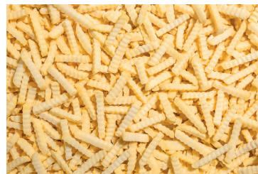
Frytki karbowane 12x12

gramatura 2,5 kg EAN 5 902 162 394 216 szt. w opakowaniu 4 szt. na warstwie 36