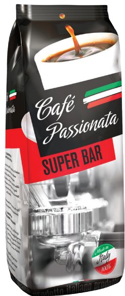
Café Passionata Super Bar

gramatura 1 kg EAN 5 902 162 380 219 szt. w opak. zb. 6 szt. na warstwie 72