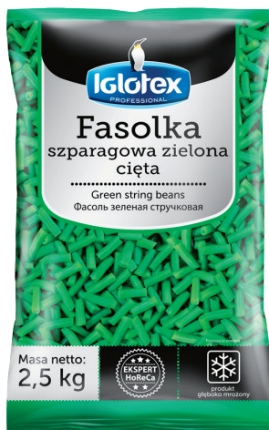
Fasolka szparagowa zielona, cięta

gramatura 2,5 kg EAN 5 902 162 363 113 szt. w opak. zb. 4 szt. na warstwie 36 Skład: brokoły