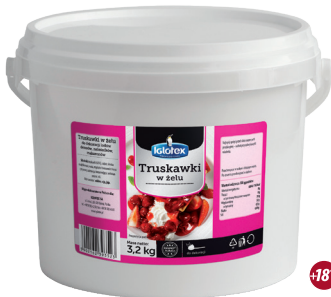
Truskawki w żelu

gramatura 3,2 kg EAN 5 902 162 393 721 szt. w opak. zb. 1 szt. na warstwie 24