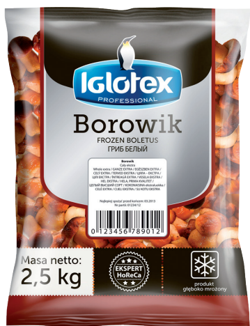
Borowik cały ekstra

gramatura 2,5 kg EAN 5 902 162 007 185 szt. w opak. zb. 4 szt. na warstwie 36