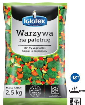
Warzywa na patelnię

gramatura 2,5 kg EAN 5 902 162 364 615 szt. w opak. zb. 4 szt. na warstwie 36 Skład: papryka zielona paski, papryka czerwona paski, papryka żółta paski