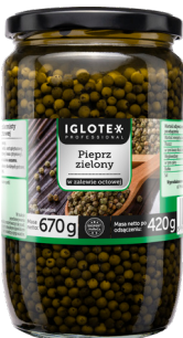
Pieprz zielony w zalewie octowej 670 g

gramatura 1,6 kg / 1 kg EAN 5 902 162 004 672 szt. w opak. zb. 6 szt. na warstwie 96