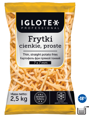
Frytki cienkie proste 7x7

gramatura 2,5 kg EAN 5 902 162 362 215 szt. w opak. zb. 5 szt. na warstwie 45