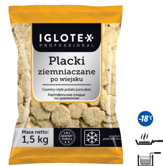
Placki ziemniaczane po wiejsku

gramatura 2,5 kg EAN 5 902 162 362 710 szt. w opak. zb. 5 szt. na warstwie 45