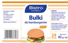
Bułka do hamburgera SE125

gramatura 82 g EAN 5 902 162 373 136 szt. w opak. zb. 24 szt. na warstwie 96