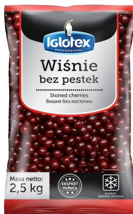
Wiśnie bez pestek