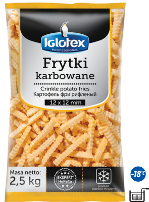
Frytki karbowane 12x12

gramatura 2,5 kg EAN 5 902 162 362 314 szt. w opak. zb. 5 szt. na warstwie 45