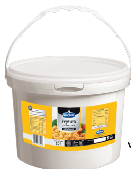
Frytura palmowa półpłynna