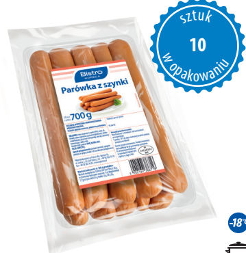
Parówki z szynki

gramatura 700 g EAN 5 902 162 386 914 szt. w opak. zb. 8 szt. na warstwie 64