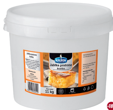
Jabłka prażone 90% kostka

gramatura 780 g EAN 5 902 162 326 545 szt. w kartonie 8 kartonów na warstwie 12