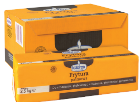
Frytura palmowa stała