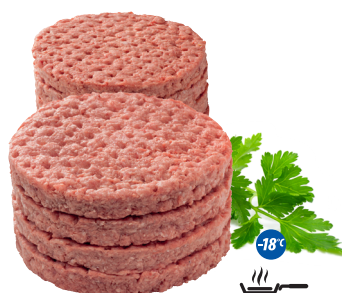
Burger wołowy 150 g