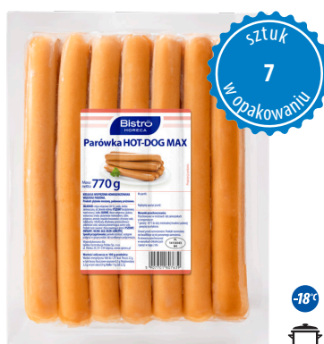
Parówka HOT-DOG MAX

gramatura 770 g EAN 5 907 701 807 653 szt. w opak. zb. 8 szt. na warstwie 64