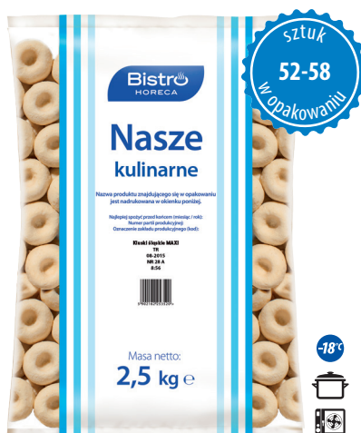
Kluski śląskie z dziurką MAXI

gramatura 2,5 kg EAN 5 902 162 276 123 szt. w opak. zb. 4 szt. na warstwie 36