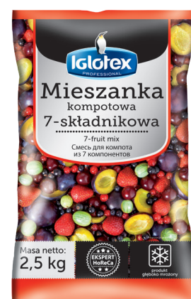
Mieszanka kompotowa 7-składnikowa