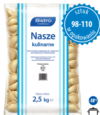
Pierogi z mięsem

gramatura 2,5 kg EAN 5 902 162 217 225 szt. w opak. zb. 4 szt. na warstwie 36