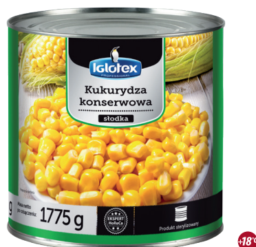
Kukurydza konserwowa słodka

gramatura 340 g / 285 g EAN 5 902 162 336 544 szt. w opak. zb. 6 szt. na warstwie 126