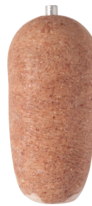
Kebab drobiowy z kurczaka