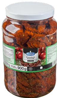
Pomidory suszone w oleju z ziołami 1,7 l

gramatura 815 ml / 430 g EAN 5 900 664 014 120 szt. w opak. zb. 6 szt. na warstwie 96