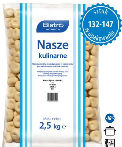
Kluski śląskie z dziurką

gramatura 2,5 kg EAN 5 902 162 276 123 szt. w opak. zb. 4 szt. na warstwie 36