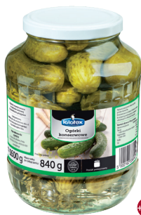
Ogórki konserwowe 1,7 l

gramatura 900 g / 450 g EAN 5 902 162 000 278 szt. w opak. zb. 6 szt. na warstwie 96