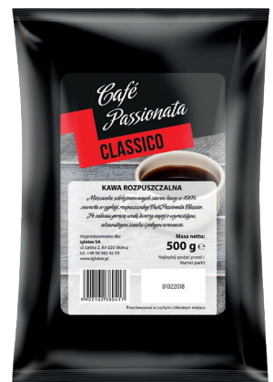
Café Passionata Classico

gramatura 500 g EAN 5 902 162 380 417 szt. w opak. zb. 10 szt. na warstwie 50