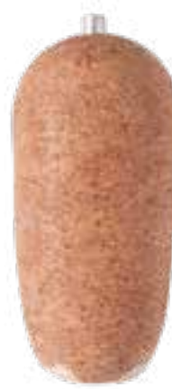
Kebab drobiowy z kurczaka