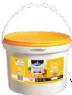
Frytura palmowa płynna

gramatura 2,5 kg EAN 5 902 162 179 233 / EAN 5 902 162 361 119 szt. w opak. zb. 4 szt. na warstwie 64 / 44