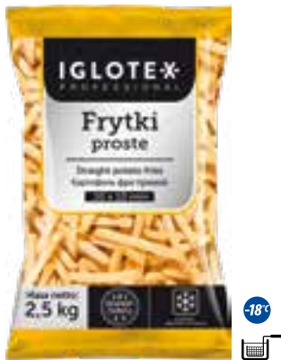
Frytki proste 10x10

gramatura 2,5 kg EAN 5 902 162 362 413 szt. w opak. zb. 4 szt. na warstwie 36