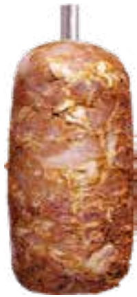
Kebab z udek i fileta kurczaka