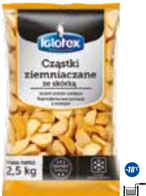
Częstki ziemniaczane ze skórką

gramatura 2,5 kg EAN 5 902 162 362 611 szt. w opak. zb. 5 szt. na warstwie 45