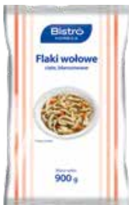
Flaki wołowe cięte blanszowane

gramatura 770 g EAN 5 907 701 807 639 szt. w opak. zb. 8 szt. na warstwie 64