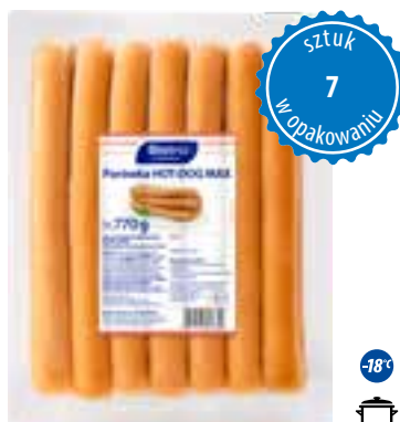
Parówka HOT-DOG MAX

gramatura 770 g EAN 5 907 701 807 653 szt. w opak. zb. 8 szt. na warstwie 64