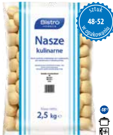
Knedle z truskawkami

gramatura 2,5 kg EAN 5 902 162 008 229 szt. w opak. zb. 4 szt. na warstwie 36