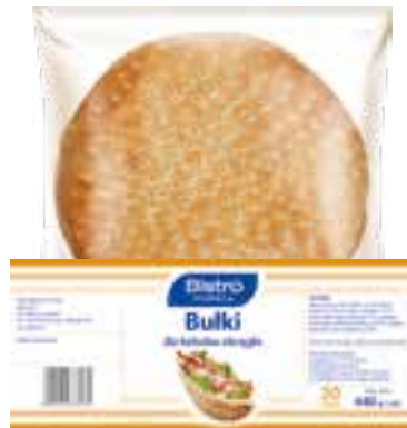
Bułka okrągła do kebaba ø30 cm

gramatura 82 g EAN 5 902 162 373 136 szt. w opak. zb. 24 szt. na warstwie 96