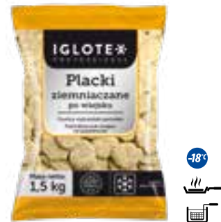
Placki ziemniaczane po wiejsku

gramatura 2,5 kg EAN 5 902 162 362 710 szt. w opak. zb. 5 szt. na warstwie 45