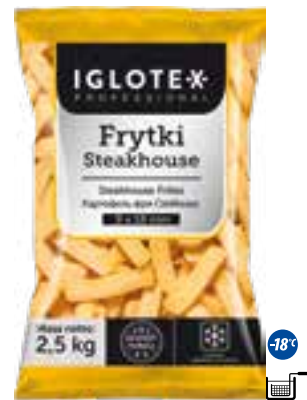
Frytki Steakhouse 9x18

gramatura 2,5 kg EAN 5 902 162 362 512 szt. w opak. zb. 5 szt. na warstwie 45