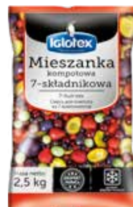
Mieszanka kompotowa 7-składnikowa