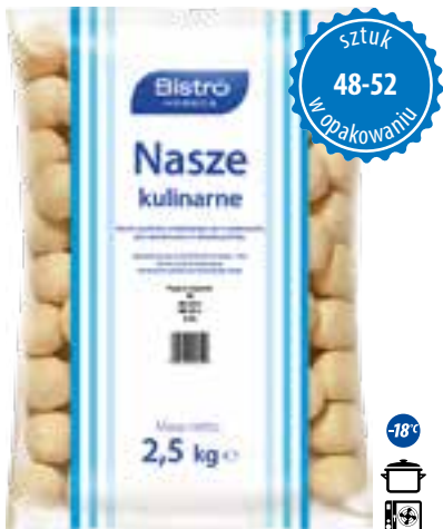
Pyzy z mięsem

gramatura 2,5 kg EAN 5 902 162 260 825 szt. w opak. zb. 4 szt. na warstwie 36