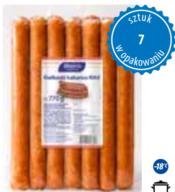
Kiełbaski kabanos MAX

gramatura 700 g EAN 5 902 162 386 716 szt. w opak. zb. 8 szt. na warstwie 64