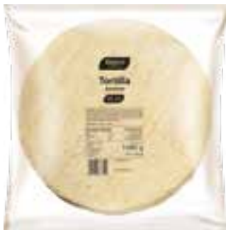
Tortilla 25 cm

gramatura 100 g EAN 5 902 162 010 697 szt. w opak. zb. 24 szt. na warstwie 144