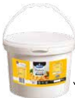
Frytura palmowa półpłynna

gramatura 10 l EAN 5 902 162 179 325 szt. w opak. zb. 1 szt. na warstwie 11