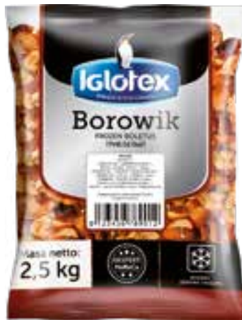
Borowik kostka kl. 1

gramatura 2,5 kg EAN 5 902 162 007 185 szt. w opak. zb. 4 szt. na warstwie 36