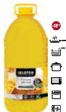
Frytura płynna bez oleju palmowego

gramatura 22 l EAN 5 902 162 361 416 / 5 902 162 385 344 szt. w opak. zb. 1 szt. na warstwie 11