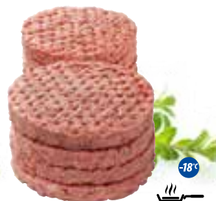
Burger wołowy 180 g

gramatura 7,14 kg EAN 5 902 162 331 938 szt. w opak. zb. 42 szt. na warstwie 336