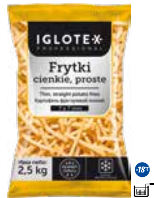
Frytki cienkie proste 7x7

gramatura 2,5 kg EAN 5 902 162 362 215 szt. w opak. zb. 5 szt. na warstwie 45