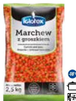
Marchew z groszkiem

gramatura 2,5 kg EAN 5 902 162 364 219 szt. w opak. zb. 4 szt. na warstwie 36 Skład: brokuł różyczki, kalfior różyczki, marchew plastry