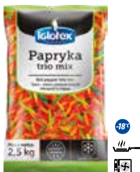
Papryka trio mix

gramatura 2,5 kg EAN 5 902 162 364 318 szt. w opak. zb. 4 szt. na warstwie 36 Skład: marchew kostka, groszek zielony