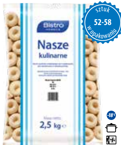
Kluski śląskie z dziurką MAXI

gramatura 2,5 kg EAN 5 902 162 276 123 szt. w opak. zb. 4 szt. na warstwie 36