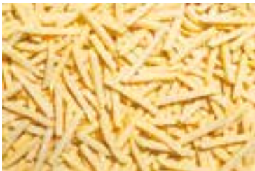
Frytki proste 12x12

gramatura 2,5 kg EAN 5 902 162 333 017 szt. w opakowaniu 4 szt. na warstwie 36