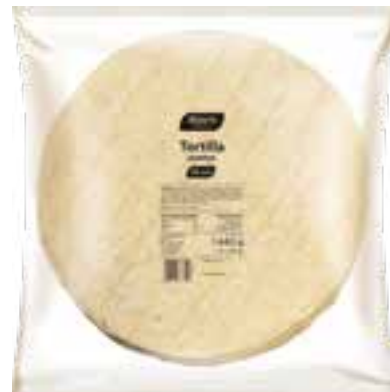
Tortilla 30 cm

gramatura 18 x 62 g EAN 5 902 162 328 211 szt. w opak. zb. 8 szt. na warstwie 48