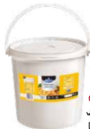
Frytura palmowa półpłynna

gramatura 10 l EAN 5 902 162 361 218 szt. w opak. zb. 1 szt. na warstwie 11