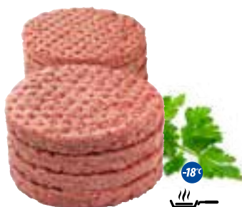
Burger wołowy 150 g

gramatura 6,75 kg EAN 5 902 162 339 033 szt. w opak. zb. 45 szt. na warstwie 210