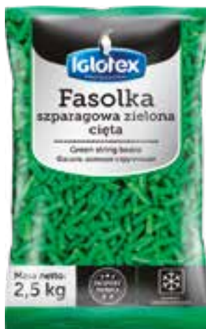
Fasolka szparagowa zielona, cięta

gramatura 2,5 kg EAN 5 902 162 363 113 szt. w opak. zb. 4 szt. na warstwie 36 Skład: brokuły