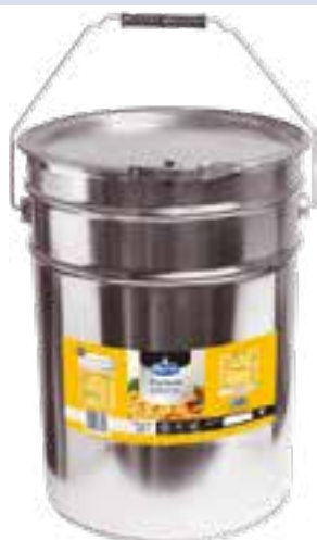
Frytura palmowa półpłynna

gramatura 20 l EAN 5 902 162 361 317 szt. w opak. zb. 1 szt. na warstwie 8 / 11