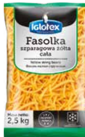
Fasolka szparagowa żółta, cała

gramatura 2,5 kg EAN 5 902 162 363 212 szt. w opak. zb. 4 szt. na warstwie 36 Skład: fasola zielona