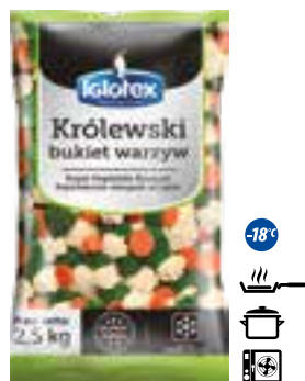
Królewski bukiet warzyw

gramatura 2,5 kg EAN 5 902 162 364 219 szt. w opak. zb. 4 szt. na warstwie 36 Skład: brokuł różyczki, kalfior różyczki, marchew plastry