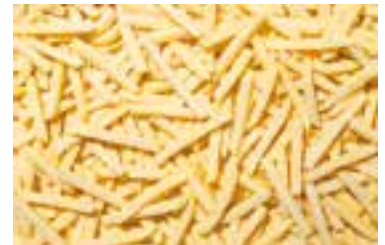
Frytki cienkie proste 7x7