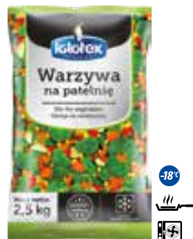
Warzywa na patelnię

gramatura 2,5 kg EAN 5 902 162 364 615 szt. w opak. zb. 4 szt. na warstwie 36 Skład: papryka zielona paski, papryka czerwona paski, papryka żółta paski