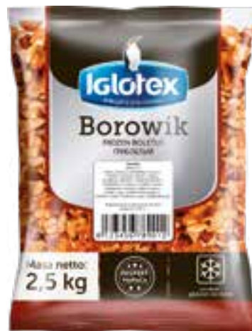
Borowik kostka kl. 2

gramatura 2,5 kg EAN 5 902 162 007 208 szt. w opak. zb. 4 szt. na warstwie 36