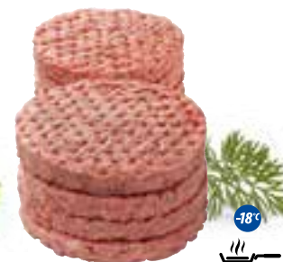
Burger wołowy 200 g

gramatura 6 kg EAN 5 902 162 331 037 szt. w opak. zb. 30 szt. na warstwie 240