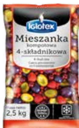
Mieszanka kompotowa 4-składnikowa