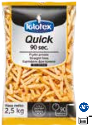
Frytki Quick 90 sec. proste 10x10

gramatura 2,5 kg EAN 5 902 162 362 116 szt. w opak. zb. 5 szt. na warstwie 45