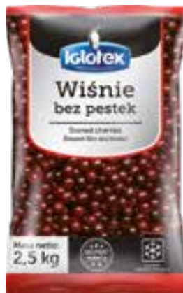
Wiśnie bez pestek