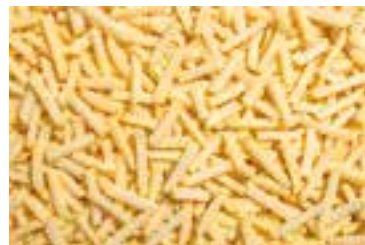
Frytki karbowane 12x12