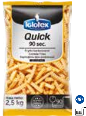
Frytki Quick 90 sec. karbowane 12x12

gramatura 2,5 kg EAN 5 902 162 362 116 szt. w opak. zb. 5 szt. na warstwie 45