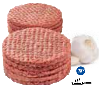
Burger wołowy 113 g

gramatura 5 l EAN 5 902 162 361 614 / EAN 5 902 162 002 876 szt. w opak. zb. 4 / 1 szt. na warstwie 40