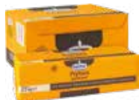
Frytura palmowa stała

gramatura 2,5 kg EAN 5 902 162 179 233 / EAN 5 902 162 361 119 szt. w opak. zb. 4 szt. na warstwie 64 / 44