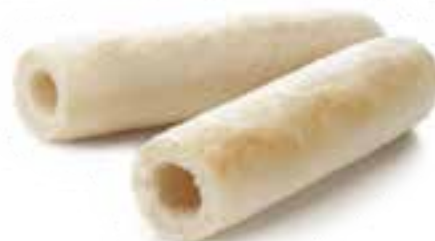
Bułka HOT-DOG francuski 60 g

gramatura 3 kg EAN 5 902 162 387 812 szt. w opak. zb. 1 szt. na warstwie 16