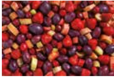
Kompot sezonowy b/p