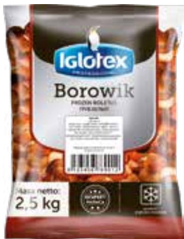
Borowik cały ekstra

gramatura 2,5 kg EAN 5 902 162 007 185 szt. w opak. zb. 4 szt. na warstwie 36