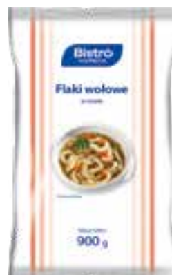
Flaki wołowe w rosole

gramatura 900 g EAN 5 902 162 395 312 szt. w opak. zb. 10 szt. na warstwie 70