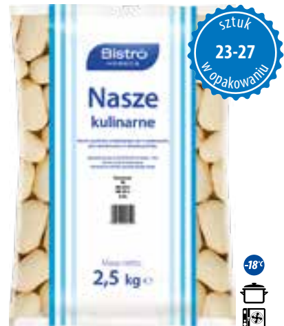
Kartacze z mięsem

gramatura 2,5 kg EAN 5 902 162 008 205 szt. w opak. zb. 4 szt. na warstwie 36