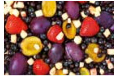
Mieszanka kompotowa 4-składnikowa b/p