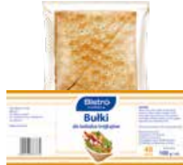
Bułka trójkątna do kebaba 19x19 cm

gramatura 450 g EAN 5 902 162 010 680 szt. w opak. zb. 5 szt. na warstwie 30