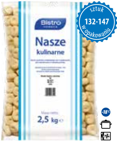
Kluski śląskie z dziurką

gramatura 2,5 kg EAN 5 902 162 276 123 szt. w opak. zb. 4 szt. na warstwie 36