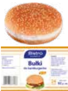
Bułka do hamburgera SE125

gramatura 82 g EAN 5 902 162 373 136 szt. w opak. zb. 24 szt. na warstwie 96