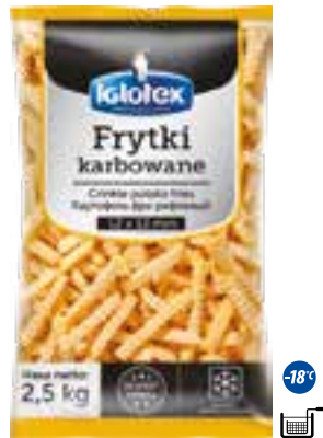
Frytki karbowane 12x12

gramatura 2,5 kg EAN 5 902 162 362 314 szt. w opak. zb. 5 szt. na warstwie 45