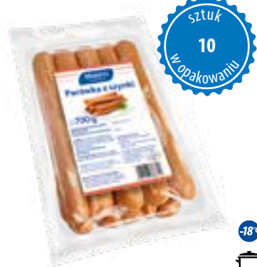
Parówki z szynki

gramatura 700 g EAN 5 902 162 386 914 szt. w opak. zb. 8 szt. na warstwie 64